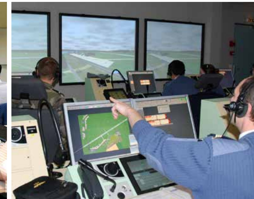
Simulateur de vol et exercices au sol.